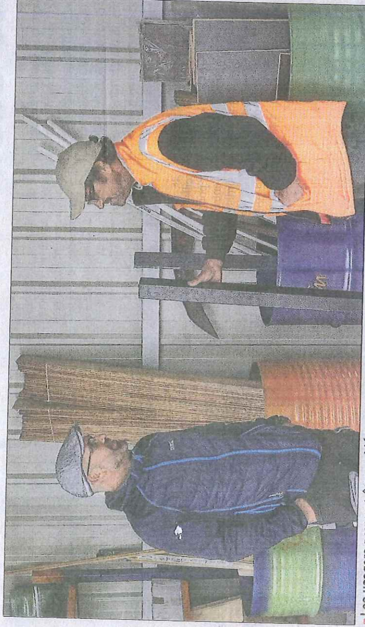
■ Les usagers peuvent être guidés par les employés de la déchetterie de La Boisse afin de déterminer ce qui peut être réutilisé – ou non – et mis sous le préau des matériaux.

Ce tas de planche ou ces parpaings vous encombre, mais ils peuvent faire le bonheur de quelqu'un d'autre. Revaloriser au lieu de jeter : c'est là le principe du préau des matériaux, mis en place par la 3CM à la déchetterie de La Boisse.