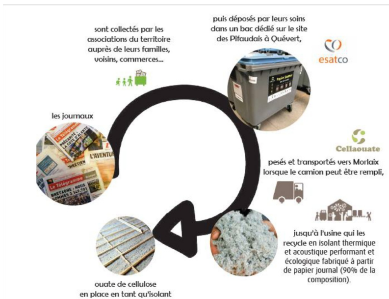
Schéma de structuration de la filière :

Les papiers acceptés sont ceux de la sorte "journal" c'est-à-dire l'ensemble de papiers imprimés en noir et/ou couleurs sur un support de type journal, tels que les journaux et gratuits. Ils doivent répondre à des caractéristiques techniques en entrée d'usine (ex : humidité inférieure à 12%, totalement exempts de corps étrangers, ...). Ces paramètres sont vérifiés par la personne responsable des dépôts sur le site d'esatco (nouveau tri sur place par les associations si besoin) et lors de la collecte de Cellaouate (containers non conformes pouvant être laissés sur place).