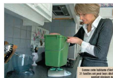
Comme cette habitante d'Arville, 31 familles ont pesé leurs déchets pendant plusieurs mois.