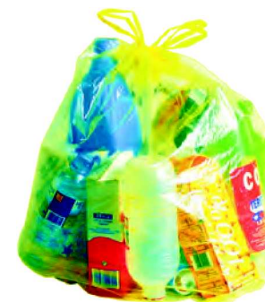
sac de collecte 50L