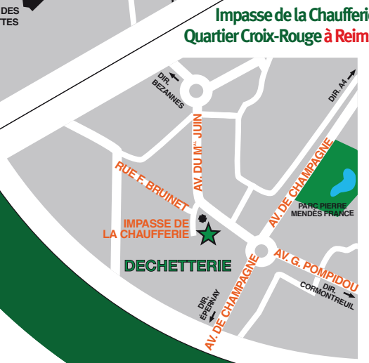
Impasse de la Chaufferie Quartier Croix-Rouge à Reims