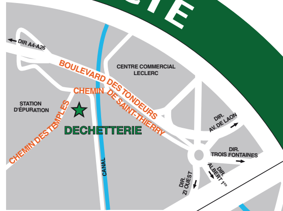
Chemin des Temples à Saint-Brice Courcelles

Horaires de 9h à 19h du lundi au samedi et de 9h à 12h le dimanche et jours fériés sauf 1 er janvier, 1 er mai et 25 décembre.