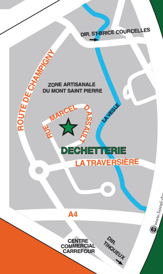
Rue Marcel Dassault à Tinqueux