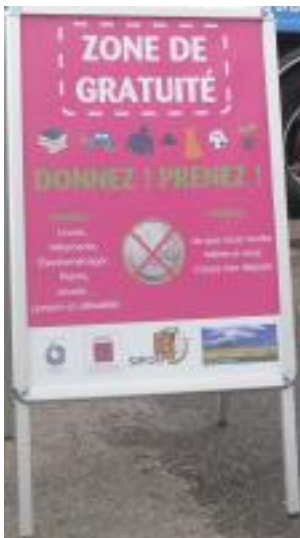
Panneau de zone de gratuité

De nombreux vide greniers sont organisés d'avril à fin octobre et nous avons systématiquement des dépôts d'objets à récupérer en plus ou moins bon état.