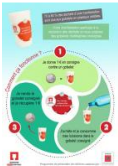
Affiche - Consignes de l'utilisation des gobelets lors des manifestations

Dans le cadre du Programme Local de Prévention des Déchets Ménagers et Assimilés dans lequel le SDED 52 est engagé, le Syndicat a souhaité promouvoir l'éco-exemplarité auprès des associations organisatrices de manifestations, touchant ainsi le tissu associatif et l'ensemble des participants aux manifestations sur le territoire de Haute-Marne via ces relais.