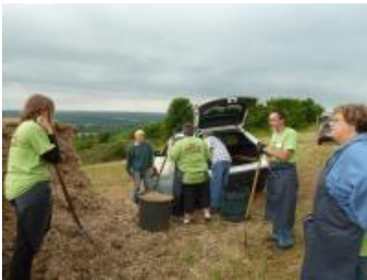
Distribution de juin 2015

La Communauté de Communes du Pays de Commercy exploite sur son territoire une truffière plantée de noisetiers qu'elle taille annuellement. Dans un souci d'éco-exemplarité, plutôt que de déposer les déchets verts issus de cette taille en déchèterie, elle a initié en 2014 leur valorisation sous forme de paillis, distribué gratuitement aux habitants du territoire dans le cadre d'une distribution annuelle au sein de la truffière.