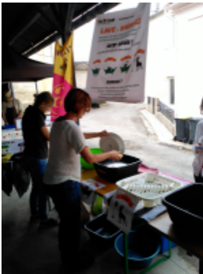
Animation Auto-Wash au Festival Ouvre la voix

Chaque événement, festival génère une quantité très importante de déchets. Si les verres réutilisables en ont permis une réduction importante, le jetable reste de mise pour les assiettes et les couverts, qui finissent après une utilisation unique, directement à la poubelle. Si certains industriels proposent des solutions intermédiaires : assiettes recyclées et/ou biodégradables, compostables, etc... nous restons toujours sur le même principe : on produit, on consomme, on jette !